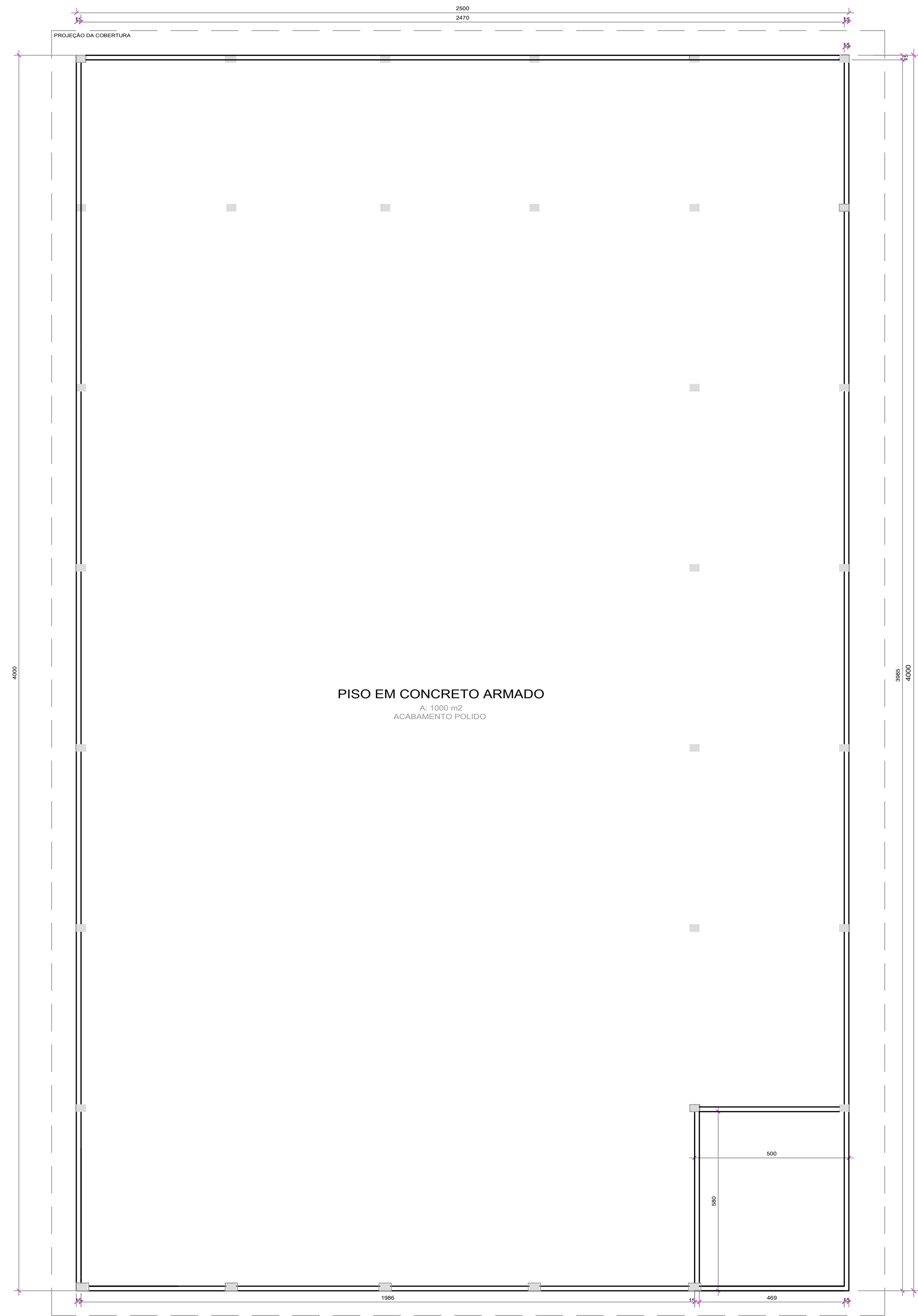
PLANTA BAIXA Escala 1/100