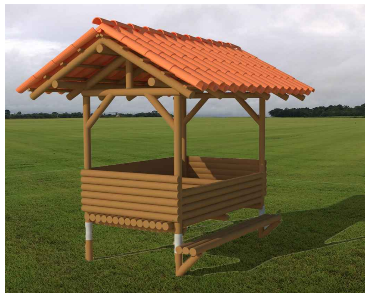
VISTA 3D SEM ESCALA